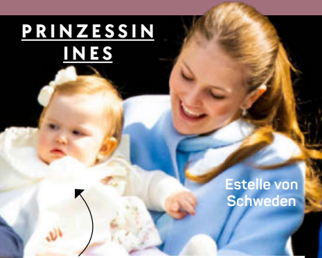
Estelle von Schweden